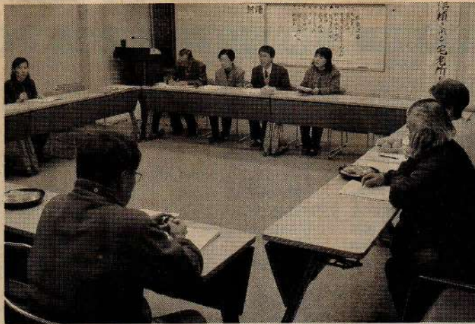
「特定非営利活動法人はるちか」の設立総会